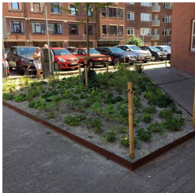
Bedene er afgrænset med en stålkant – og plantesammensætningen i dette bed afspejler en mere skyggefuld placering end de øvrige bede.