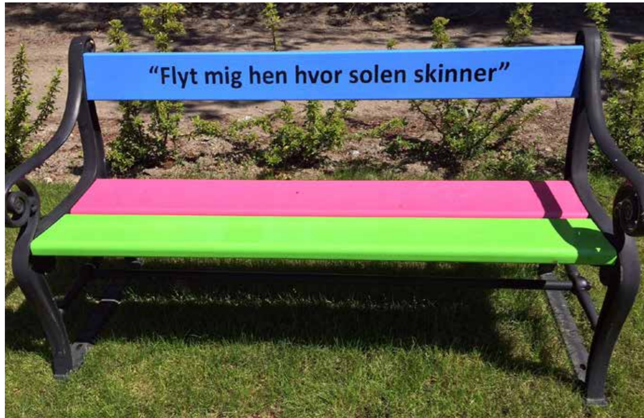
De farverige bænke på Bispebjerg Kirkegård har givet inspiration til en lettere variant af flytbare siddepladser på Ribe Kirkegård.

Sådan stod der på en farverig bæk på Bispebjerg kirkegård for år tilbage. Disse få ord gjorde et stort indtryk, fordi bænken var så indbydende og virkelig sagde velkommen.