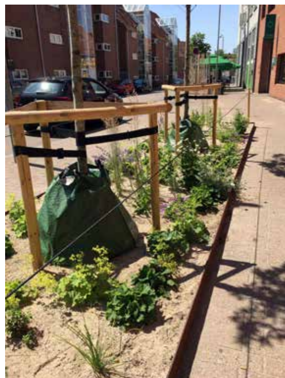
De ny tilplantede bede er toppet med grus og afgrænset med en snor, for at give planterne den bedste start.