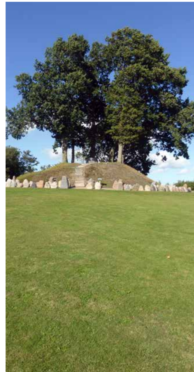
Mindelunden er anlagt til minde om Broagerlands faldne soldater i den 1. Verdenskrig.

Fra kirkegården ser man bl.a. ud over et stort græsareal med en markant høj, omkranset af 2 rækker af sten. Det er en mindelund over de soldater fra Broagerland, der faldt i den 1. Verdenskrig. På toppen af højen er rejst en sten med flg. indskrift "Sten sat over Broager Land Sønner til Minde faldne i Krigen 1914-18". På et skilt ved højen kan læses flg. tekst: