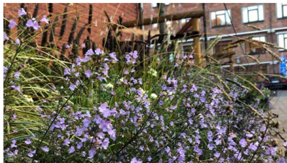
De blomstrende bede har bidraget til et løft af gaden og har fået en positiv modtagelse.

etableringsfasen har vi også valgt at afgrænse arealet med snor for at give planterne de bedste betingelser for en god start.