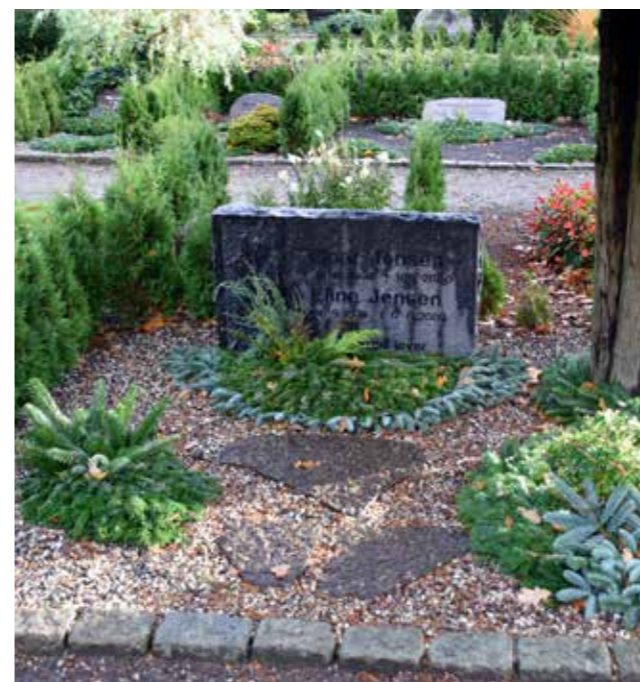
Udgangspunktet for dækningen er 5 kg. Nordmannsgran pr. gravplads, samt diverse materialer til pyntning af decorationen.

En udfordring på nogle kirkegårde kan være, at gangene er dækket med et tykt lag pyntegrus, som kan være uhenigtsmæssigt i forhold til at danne grundlag for en stillestående arbejdsplads. Den udfordring har vi ikke, da gangene historisk set altid har været jorddækket. Et forhold