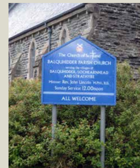
Balquhider Church Cemetery er en meget besøgt kirkegård. Her er den berømte skotske klanleder Rob Roy begravet.