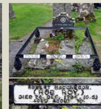
Rob Roy's gravsted. Det med fødsels- og dødsdatoer var der ikke så meget styr på dengang.