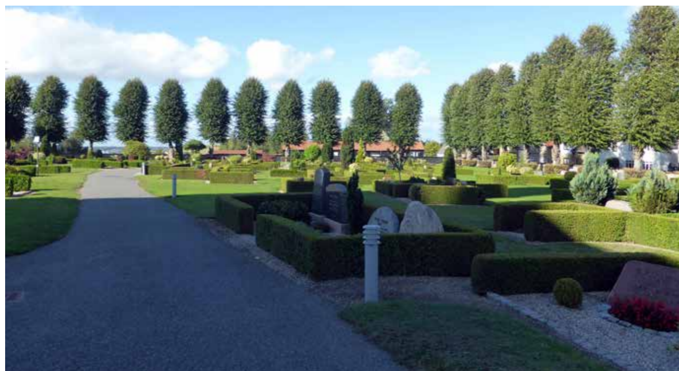
Kirkegården ligger højt og er indrammet af høje stensætninger, stendiger og stynede træer.

Af Lene Halkjær Jensen, redaktion@danskekirkegaarde.dk