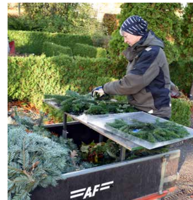
Dekorationerne laves på bøjelige drypbakker, der kan købes i en hver køkkenforretning.

som ikke kun giver et udmærket 'gulv' til arbejdspladsen, men også en god tilgængelighed for handicappede og dårligt gående besøgende på kirkegården.