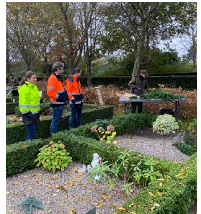
Udendørs laves gran på slisker, og glides af på gravstedet.

komme med 6 personer, som alle var nysgerrige på, hvordan der lægges gran hos os.