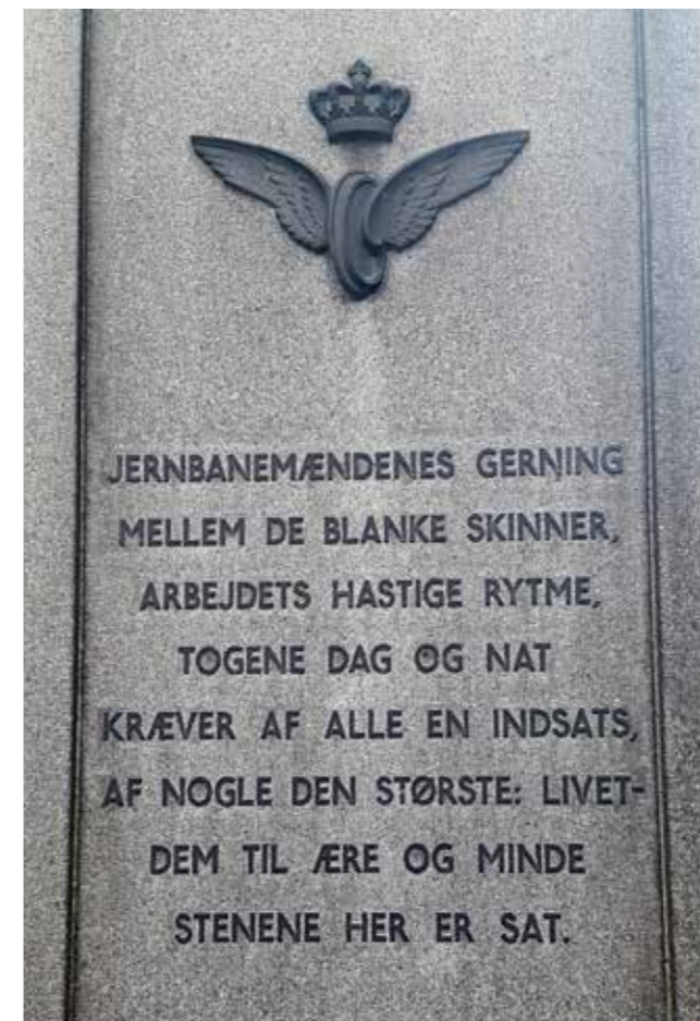
Indskrift på den store Fælles Mindesten: