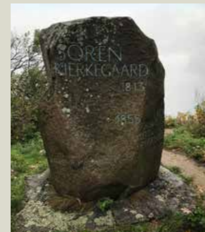
Mindestenen for Søren Aabye Kirkegaard (1813 – 1855) på Gilbjerg. Søren Kirkegaard er begravet på Assistens Kirkegård i København.