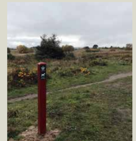
Naturområdet Gilbjerg Hoved er fredet, men der er alligevel god grund til at tage de 4-benede familiemedlemmer med på et besøg her: Området er samtidig et fritløbsareal for hunde, så man må forvente at møde en hel del glade og snorefri vovser.