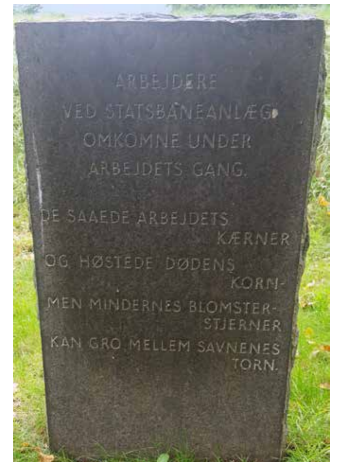
Indskrift på den ene Mindesten til højre for den fælles Mindesten:

Jernbanemændenes gerning mellem de blanke skinner, arbejdets hastige rytme, togene dag og nat, kræver af alle en indsats, af nogle den største: livet, dem til ære og minde stenene her er sat. Rejst år 1939 i fællesskab af De danske Statsbaner og statsbanepersonalets Organisationer til minde om arbejdsfæller. DSB – DIF – DLF – JBF – VRF.