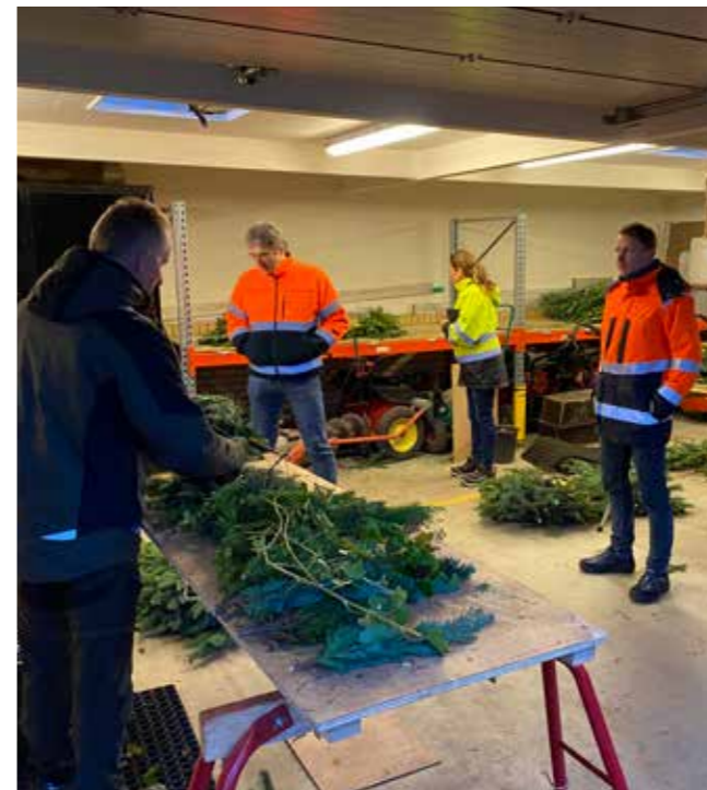
Dekorationer laves inden døre på plader.

Denne tidlige onsdag morgen havde AT meldt at de ville