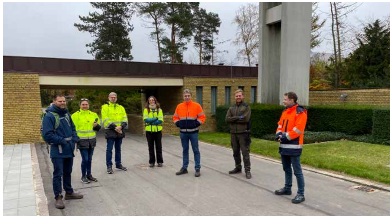
Arbejdstilsynet var mødt talstærkt op; alle var nysgerrige på hvordan grandækningen foregik.

Onsdag d. 11. november havde AT meldt deres ankomst på Risbjerg kirkegård, som er en del af Folkekirkens kirkegårde i Hvidovre.