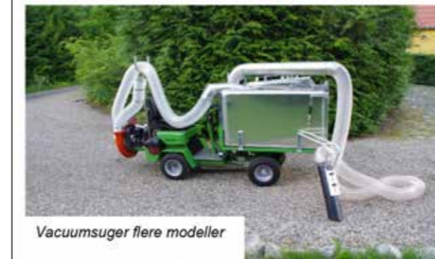
Vacuumsuger flere modeller