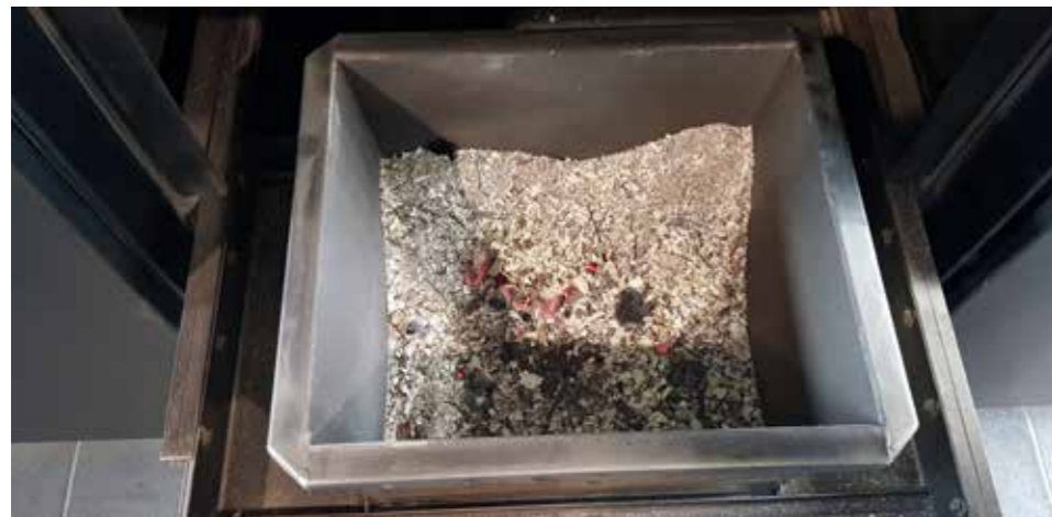
Foto fra prøvebrænding af den nye SAGA kiste: Prøvebrændingen skal forløbe roligt og uden dannelse af sodpartikler. Farven af asken skal være lys/grå, som viser, at asken er fuldstændigt udbrændt.

der kunne antænde de efterfølgende filtre med aktivt kul for rensning af kviksløv. Det skal naturligvis sikres, at brænding af kister ikke medfører brandfare andre steder i krematoriet.