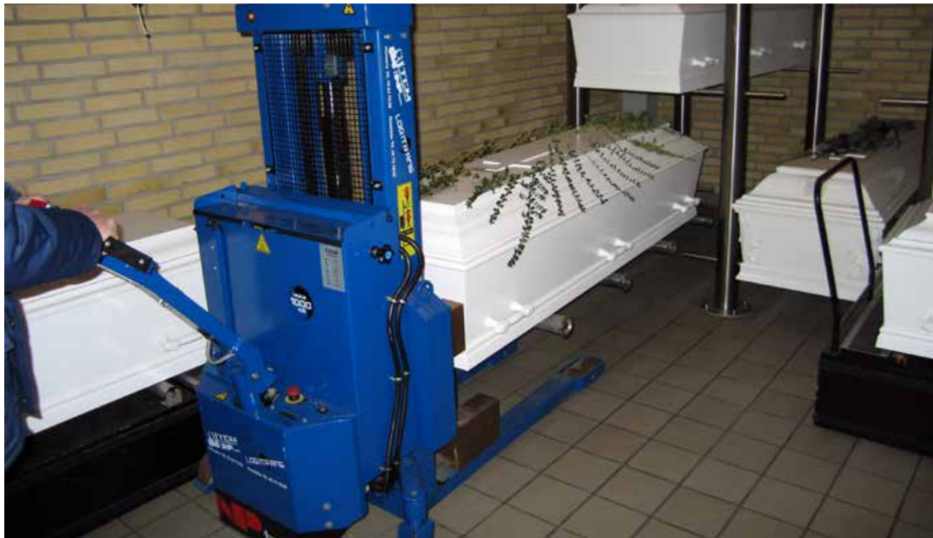
Håndtering af kisten skal kunne foregå med det sædvanlige udstyr på et krematorium.

I sidste nummer af Kirkegården blev den nye SAGA kiste fra Tommerup Heilskov ApS præsenteret. Det forudgående arbejde med at udvikle den bæredygtige kiste af papir har været intenst og kreativt.