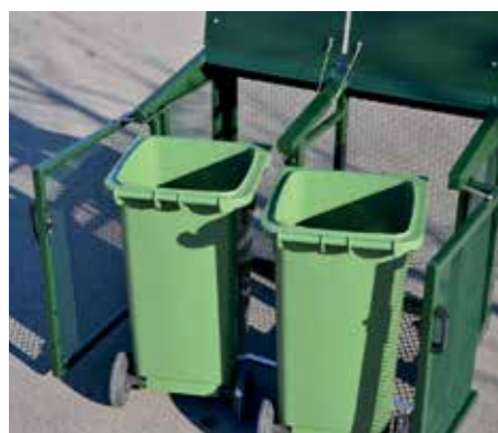
affaldssortering med bl.a. BIKAB