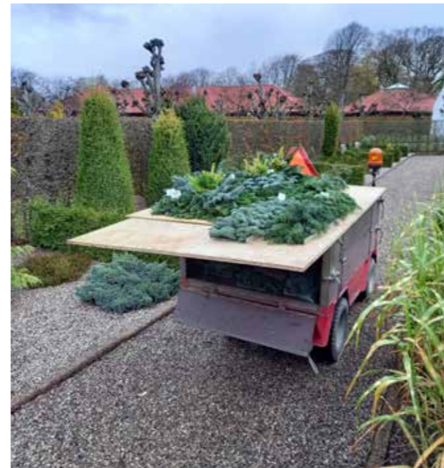
Granpyntningerne køres ud i løbet af dagen. Alle medarbejdere deltager i udkørsel og klargøring af gravsteder, hvilket giver en god variation i arbejdsopgaverne.

Granpyntningen i Gjellerup har, som så mange andre steder her i landet, foregået ude på gravstedet; for det har vi jo altid gjort, og sådan er det! Vi er måske nok nogle her i branchen, som har været lidt fodslæbende i forhold til at forny os, og se nye muligheder - for det skal jo være som det plejer! Arbejdstilsynet har gennem de senere år haft et fokus på, hvordan vi udfører opgaven. Nogle er blevet tvunget til at ændre i måden at lægge gran på, mens andre har set nye muligheder i at gøre det på en anden måde.