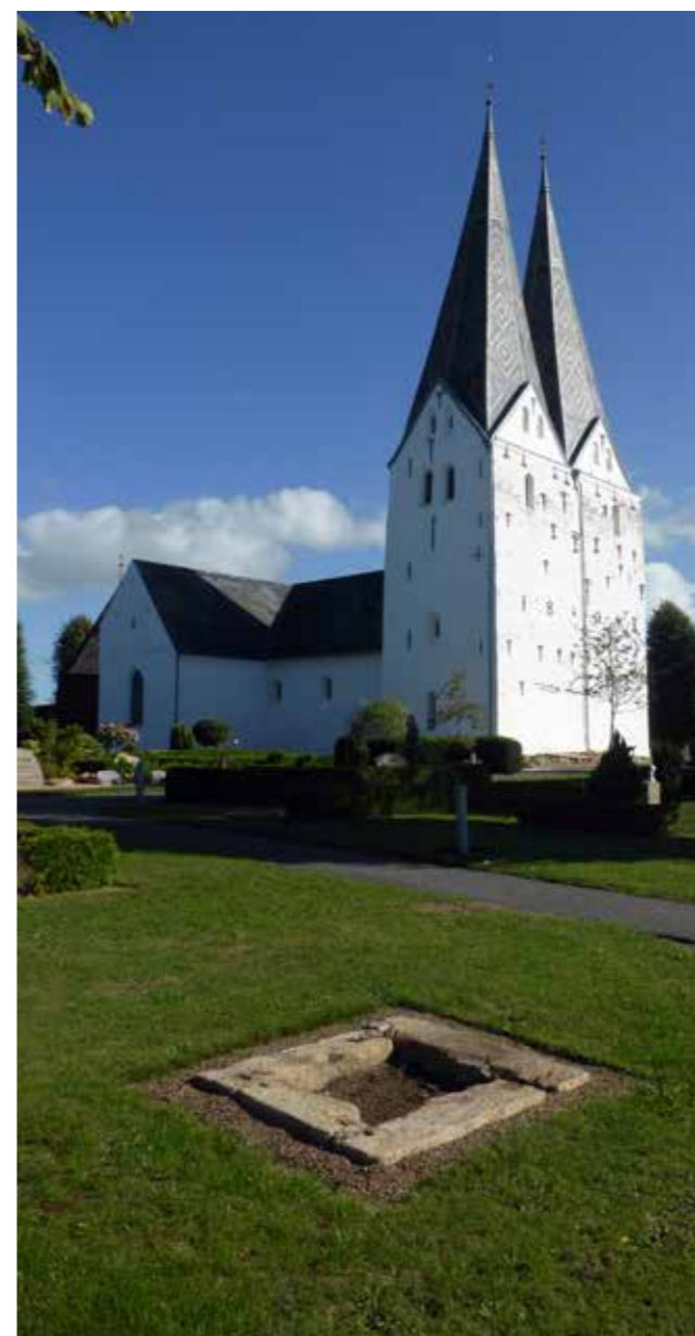
Broager Kirke er markant i landskabet med sine to spir og den høje beliggenhed.

Noget af det første, der fanger blikket, er en høj træbygning, der straks leder tanken hen på middelalderbørge og tilfangetagne jomfruer i nød. Bygningsværket har dog intet med nødstedte jomfruer at gøre; det er et klokkehus – og med et grundareal på 7 x 7 meter, er det landets største fritstående klokkehus. Klokkehuset blev opført i 1650, da kirketårnet ikke var stærkt nok til at bære kirkens tre klok-