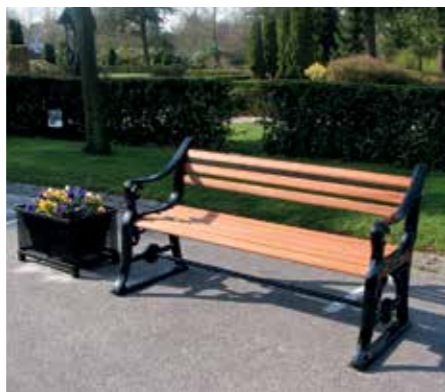
klassisk og moderne indretning på kirkegården