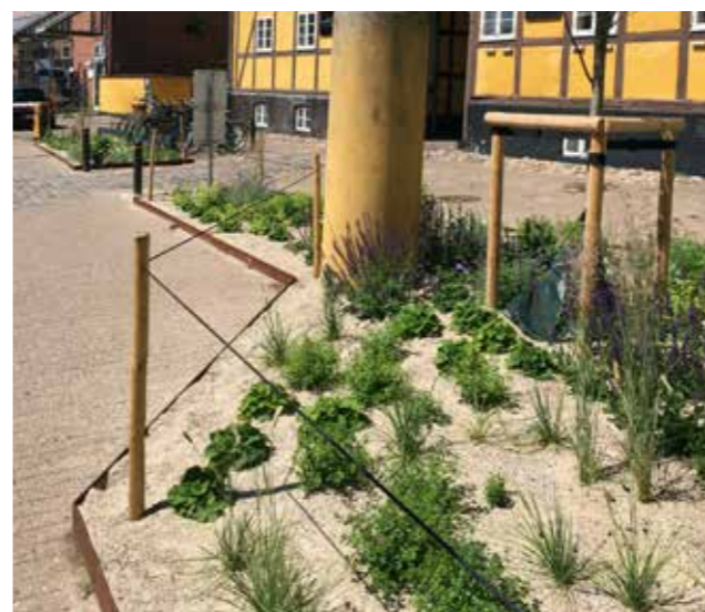
Stauderne blev plantet i foråret 2020 og er allerede vokset godt til.

Vi har valgt en god ren muld og toppet bedene med 7-10 cm vasket grus. Det har vi gjort for at reducere ukrudtsmængden, lette lugningen og holde på fugten i muldlaget. Desuden passer udtrykket med en grus-bund flot til de valgte farver og omgivelser. Til gengæld er vores erfaring at beplantningen kræver lidt ekstra vanding det første etableringsår, indtil stauderne har fået godt fat i mulden. I