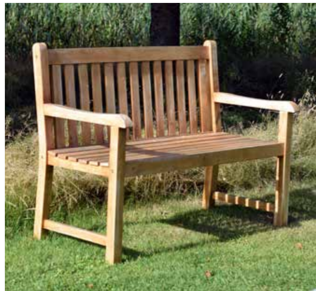
Bænkene på Ribe Kirkegård er ikke ens, men man sidder fint alligevel.