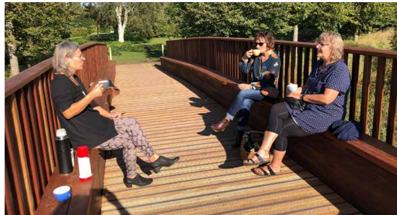
På den næsten ny-indviede bro over åen er siddepladser også tænkt ind – og de bliver brugt.