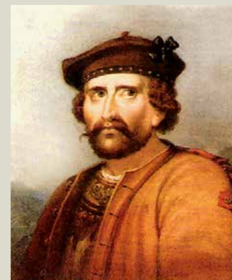
W.H. Worthingtons portræt af Rob Roy er malet i 1830'erne. United States public domain.