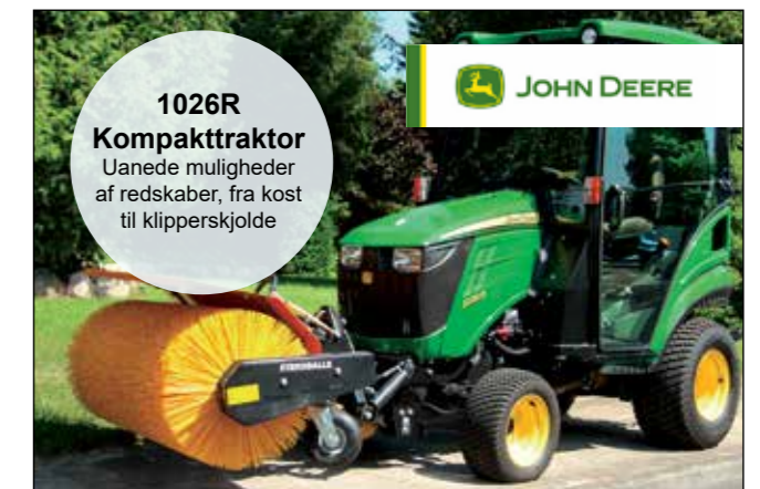
1026R Kompaktraktor Uanede muligheder af redskaber, fra kost til klipperskjolde