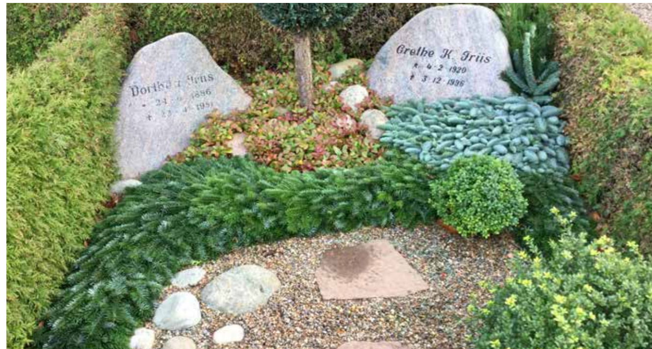
I alt bruges der ca. 4.000 kg normannsgren, 1.500 kg nobilis og 1.800 kg bjergfyr til grandækningen.

omlagt dem til en mere tidssvarende begravelsesform. Vi har i samarbejde med WAD arkitekter, fået lavet en god løsning som indeholder flere plænebegravelser og skovkirkegård, men der vil også blive bevaret lidt af den gamle kirkegård. Jeg kan desværre ikke vise tegninger eller andet, da vi ikke har fået det godkendt i provstiet endnu. Det har været en spændende proces, at være med til at tegne fremtidens kirkegård; der er mange elementer der skal spille sammen såsom brugerønsker, driftsøkonomi samt respekten for kirkegårdens alder. Jeg synes vi er kommet godt i mål, selvom der kan gå en del år, inden vi kan komme i gang for alvor.