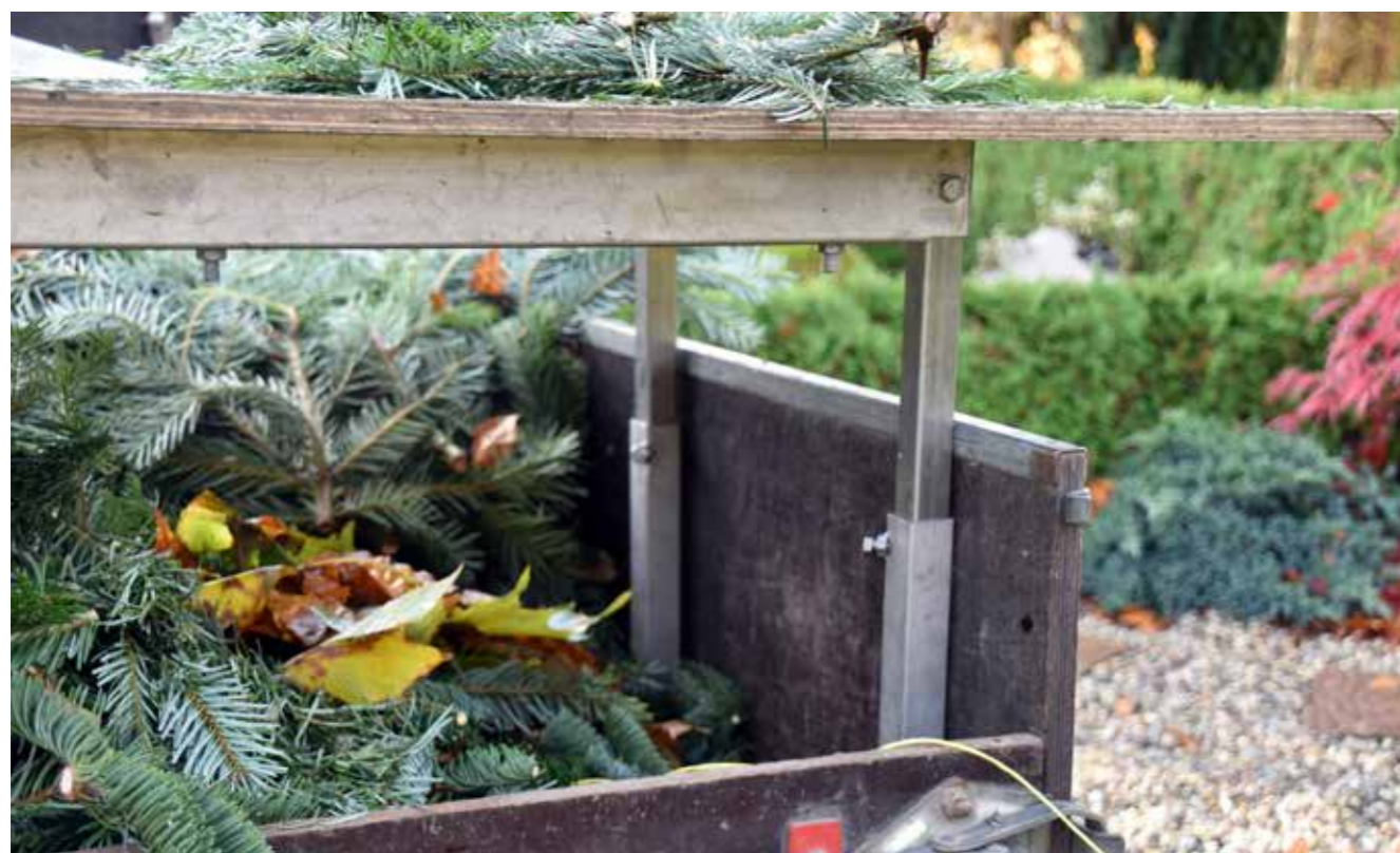
Nærbillede af hæve/sænkebord.

I Tønder har vi valgt at etablere mobile arbejdspladser, som lever op til Arbejdstilsynets krav om, at der ikke må være mere end to timers knæliggende arbejde.