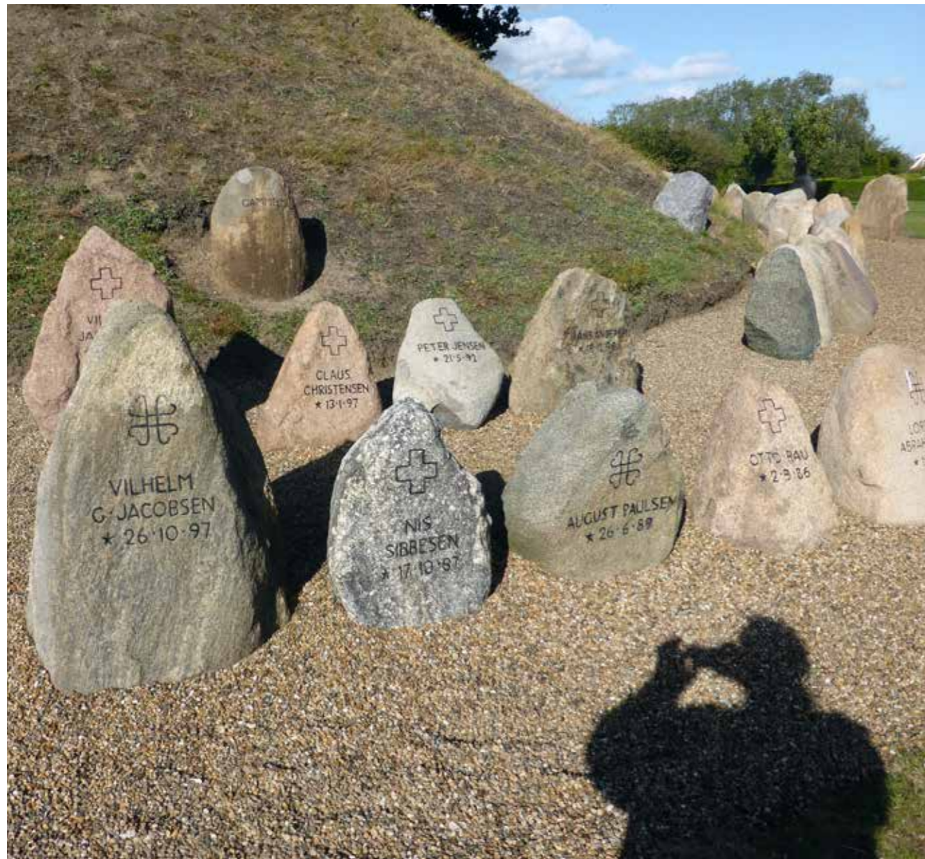
De 165 gravsten omkring højen er grupperet efter de afdødes hjemsted, i hver af de 9 små kommuner på Broagerland.