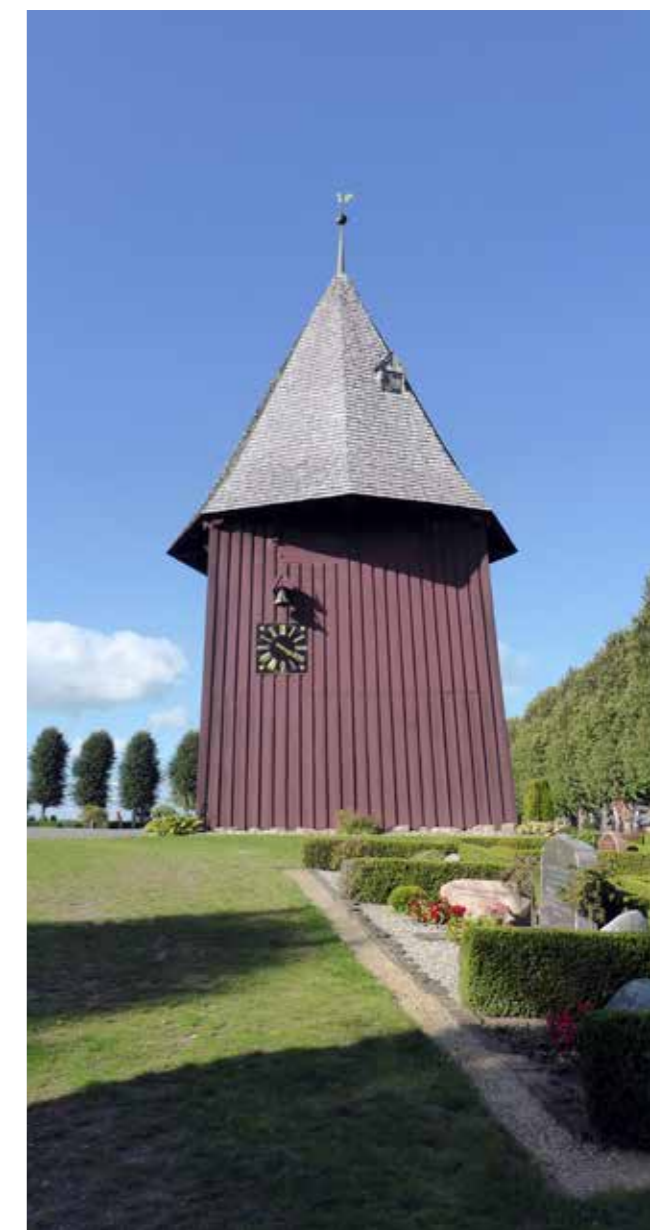
Klokkehuset fra 1650 er Danmarks største, fritstående klokkehus.

ker. Kirketårnet er siden blevet forstærket, og klokkerne blev flyttet tilbage i kirketårnet i 1904. I dag bruges klokkehuset som kapel.