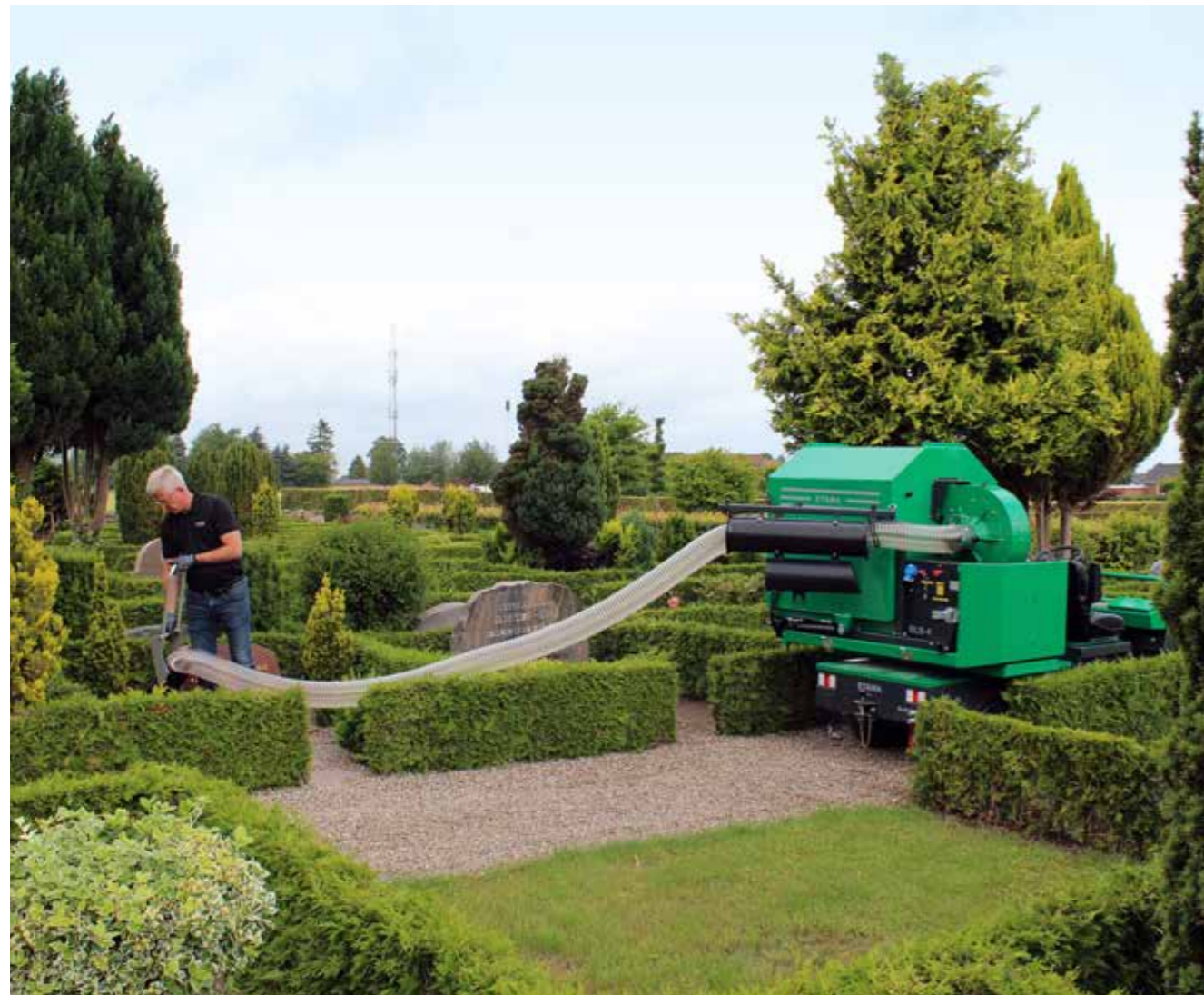
Normalt betyder løvsugning at der skal løftes tunge sække med våde blade. Det er slut med STAMAs nye, elbaserede løvsugere, fx Sugeenhed ELS-B 48V - her monteret på en Multi EL truck. I det hele taget sker der en enorm udvikling på el-området i disse år.