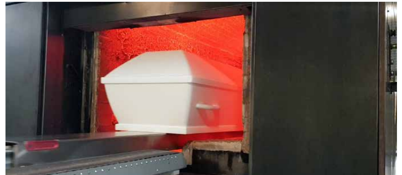
Foto fra prøvebrænding af den nye SAGA kiste: Det er et krav, at kisten ikke må antænde for hurtigt ved indsætning af kisten i ovnen: Antændelsesperioden bør være mindst 25 sek. ved en ovntemperatur på 800 °C.

Kister til kremering skal overordnet opfylde følgende krav: "Formålet med godkendelse af kister egnet til brænding er at sikre, at brændingen af den enkelte kiste kan foreta-