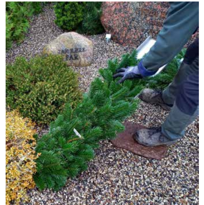
Borterne laves på slisker og kan lægges på det gravsted, hvor de passer bedst.

I Gjellerup arbejder vi med 3 typer af granpyntninger: 'Almindelig pyntning', 'Fyr, bed og dekoration' og 'Bed og dekoration'. Prisen på de forskellige typer er beregnet ud fra tid og mængde.