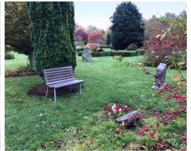
Mange steder har bænke en fast placering og et ensartet udtryk. På Ribe Kirkegård er der flere forskellige bænke - og nogle af dem kan flyttes.