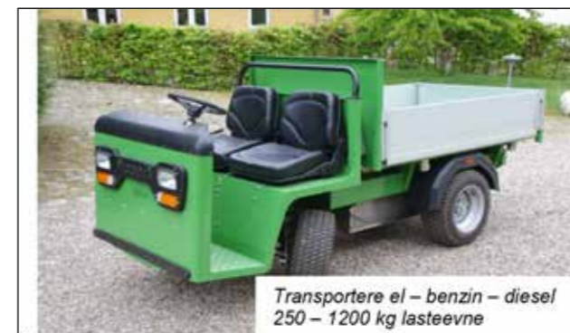
Transportere el – benzin – diesel 250 – 1200 kg lasteevne