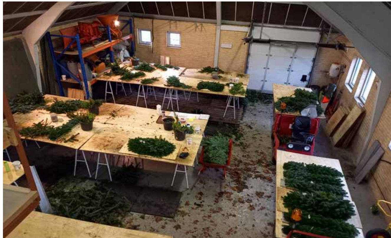
Granpyntningerne laves indendørs ved borde, der er tilpasset i højden til den enkelte medarbejder. Den nye metode har gjort grandækningen til en opgave, der ses frem til.

Granpyntningen af gravsteder har igennem årene ændret sig. Før i tiden var det en stor mængde gran og fyr der skulle til, for at et gravsted tog sig pænt ud.