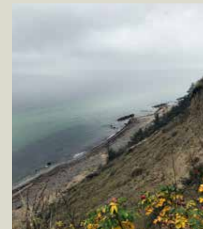
Udsigten fra toppen af Gilbjerg, ved Kirkegaards mindesten, er formidabel. På klare dage kan man tydeligt se til Kullen i Sverige og der er et stejlt fald til den stenede strand nedenfor.