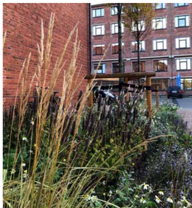
Stauderne klippes ned til foråret, så man vinteren igennem får glæde af de visne frøstande.

Alt i alt har projektet bidraget til et løft af gaden, og det har fået en flot positiv modtagelse. ■