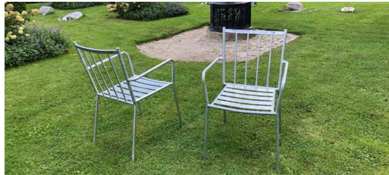
De lette og flytbare stole på Ribe Kirkegård er forsynet med teksten 'Flyt mig hen hvor solen skinner' og har ikke nogen fast plads.

En siddeplads behøver ikke at være en bæk eller en stol. Det kan bare være en sten, eller noget helt andet. Det kan være vores fortællegynger, ja selv på vores bro som fører over åen har vi tænkt siddepladser ind. De er