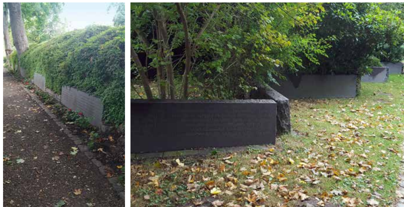
DSB's Mindelund rummer navnene på mere end 800 ansatte, der er omkommet i tjenesten.